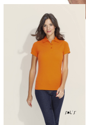
PRIME WOMEN 00573